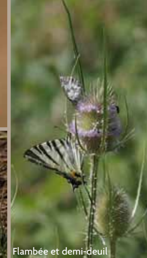
Flambée et demi-deuil