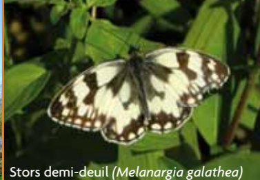
Stors demi-deuil ( Melanargia galathea )