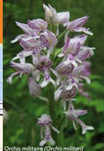
Orchis militaire ( Orchis militari )