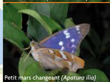
Petit mars changeant ( Apatura ilia )