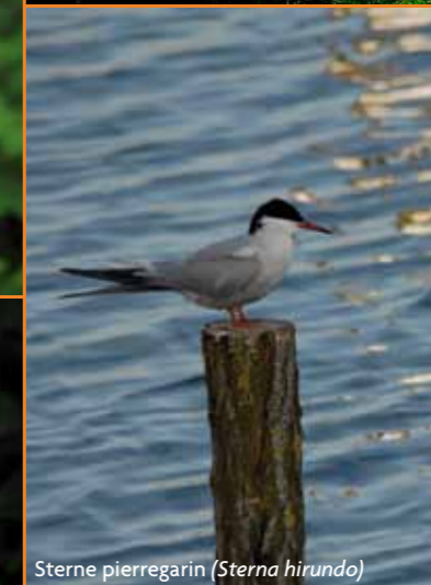
Sterne pierregarin ( Sterna hirundo )