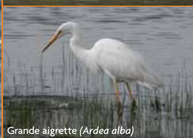
Grande aigrette ( Ardea alba )