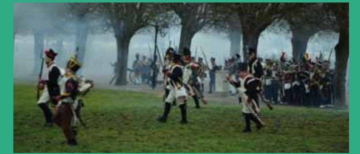
Photos de la reconstitution du bicentenaire de la bataille de Montereau (18.02.2014).